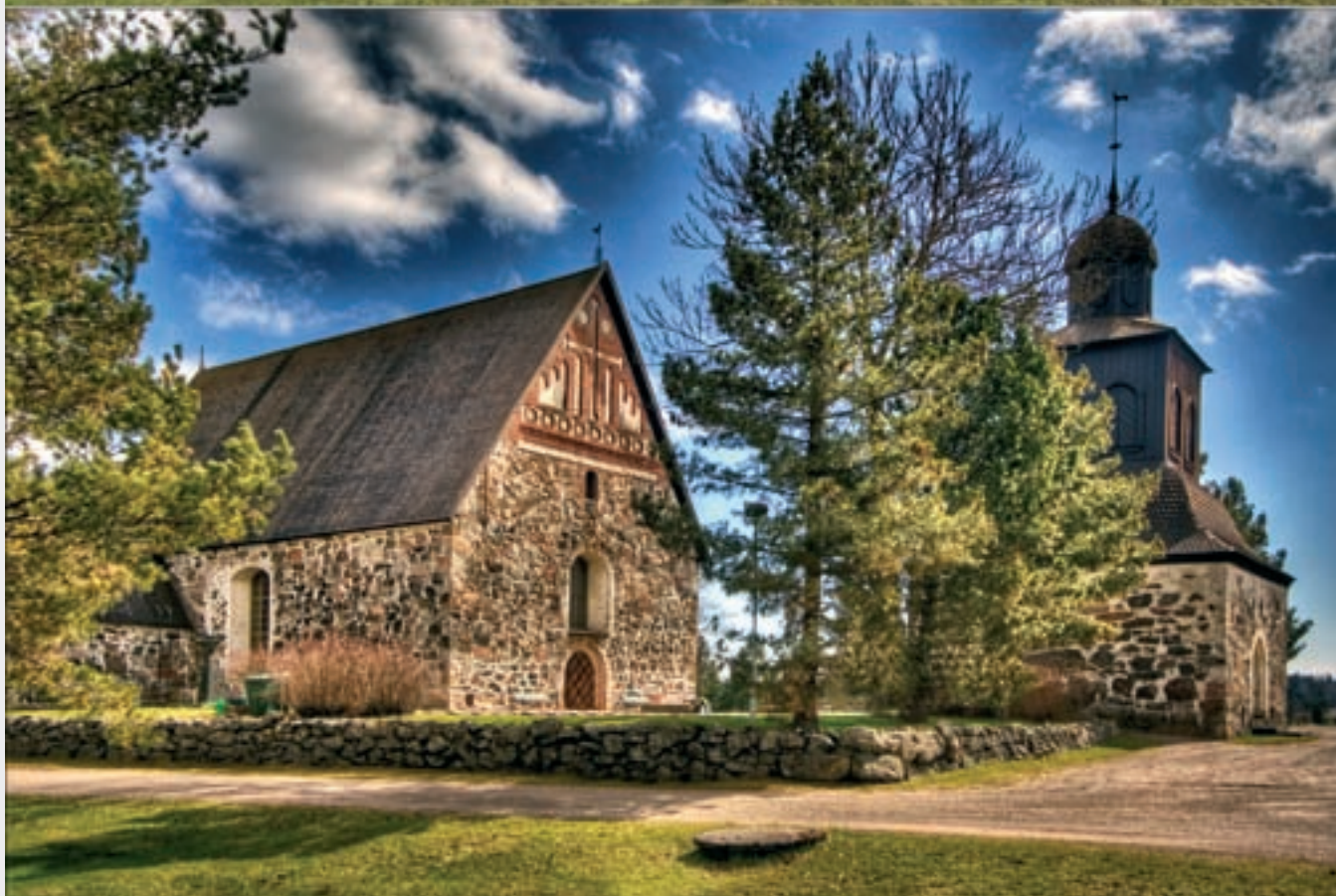
Ensimmäinen kuva on Photomatix-ohjelman tuottama HDR-kuva ennen sävyjen säätämistä. Dynamiikka on suurimmillaan, mutta kuva on mielestäni äärimmäisen lattea. Toisessa kuvassa sävyjä on jyrkennetty.